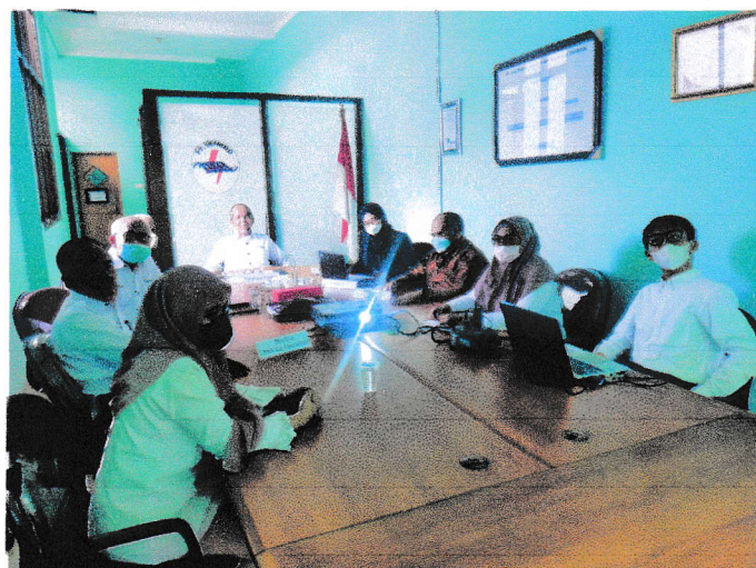
AUDIT MUTU INTERNAL DIV. TEKNIK & OPERASIONAL :