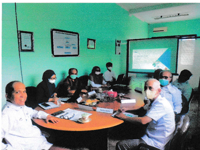
AUDIT MUTU INTERNAL TOP MANAJEMEN :

PEMBUKAAN ACARA DAN HARI PERTAMA AUDIT MUTU INTERNAL 2022 PADA TANGGAL 17 FEBRUARI 2023: